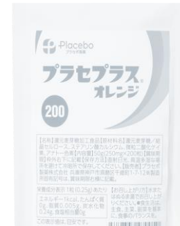
プラセプラス・オレンジ 200