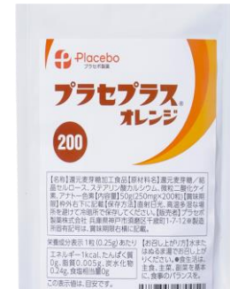
プラセプラス・オレンジ200